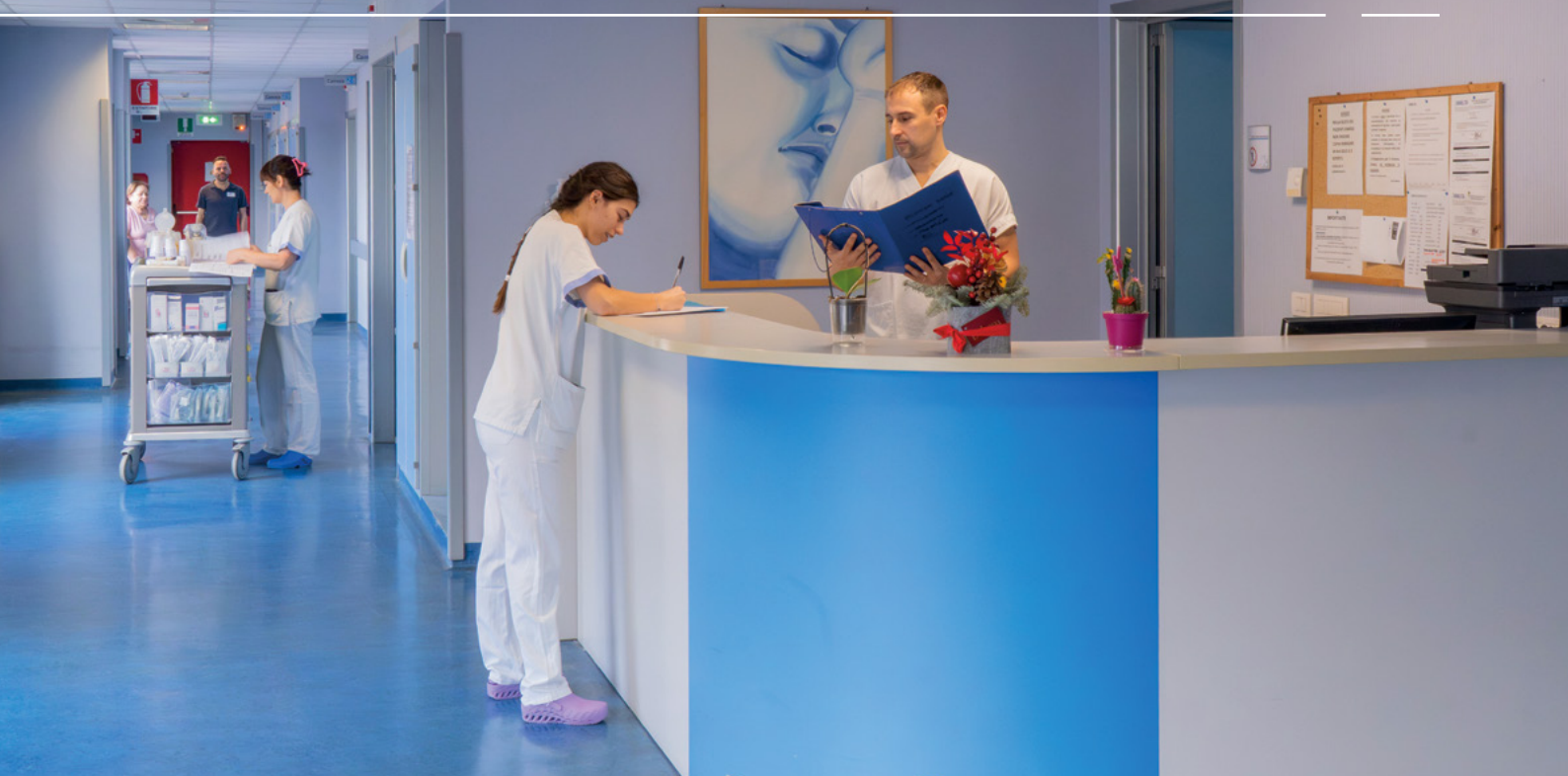
Reparto di degenza Ospedale Faccanoni di Sarnico

le realtà territoriali, come Sarnico, adeguino i loro standard assistenziali e riabilitativi a tipologie di pazienti sempre più fragili e complessi, sviluppando capacità di accoglienza precoce per pazienti dimessi dalle unità operative per acuti con bisogni ad elevata intensità di cura . Raggiungere questo livello di competenze è stato un percorso lungo ed articolato fondato su una precisa volontà aziendale fatta d'investimenti di risorse sia tecnologiche che tecnico-professionali, di un metodo validato di formazione del personale con skills adeguate al recupero delle funzioni e della massima autonomia del paziente».