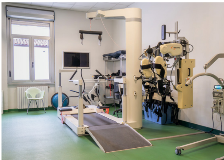
Lokomat per la deambulazione con ortesi robotica

Accanto all’attività di degenza, l’Ospedale di Sarnico svolge un ruolo di riferimento anche sul fronte ambulatoriale . L’Unità Operativa di Diagnostica per Immagini , dotata di strumentazioni avanzate come Risonanza Magnetica ad alto campo, TAC, mammografo digitale, RX e il poliambulatorio specialistico completano un’offerta pensata per rispondere in modo efficace e vicino alle esigenze della popolazione del Basso Sebino.