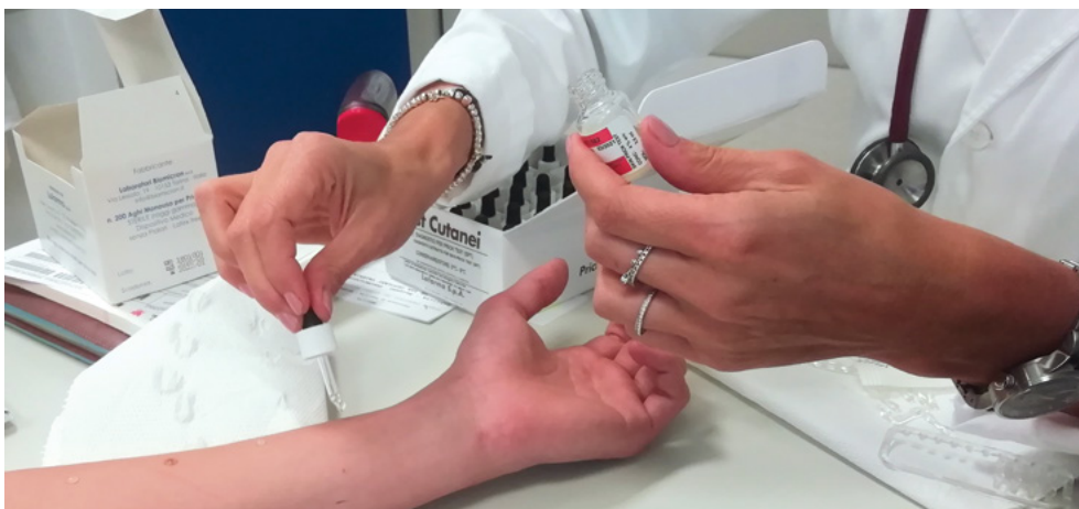
Paziente che si sottopone a un Prick Test.

«Sarebbe il caso di una visita specialistica quando i sintomi legati a un'allergia risultano particolarmente gravi o persistenti , se si verificano difficoltà respiratorie o asma , oppure se si è in presenza di altre patologie che potrebbero aggravarsi a causa di un'allergia».